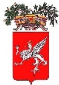
Provincia di Perugia