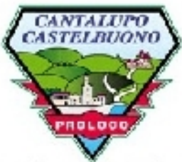
Pro loco Cantalupo Castelbuono