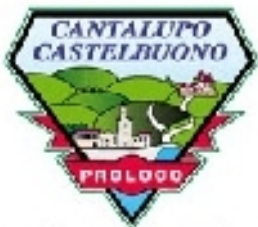
Pro loco Cantalupo Castelbuono